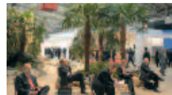
Jovisst är det ExpoReal!