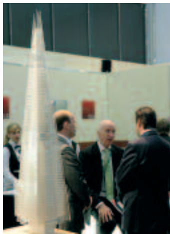
CLS visade upp The Shard förra året.