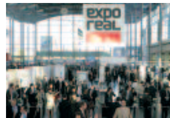
Fler besökare och större yta i år.