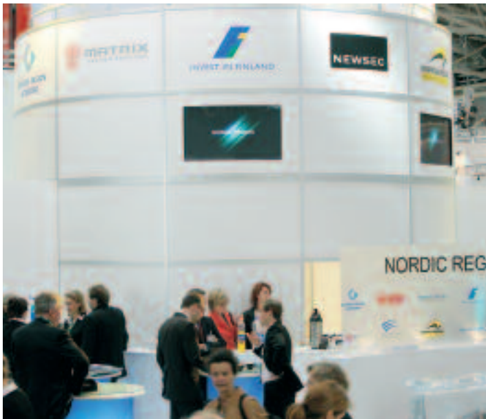
"Nordic Region" samsades i en monter i hall B förra året.

soner i företagsledande position utan av alla yrkeskategorier med anknytning till fastigheter och byggsektorn. Profilen på många av utställarna känns igen från mässan i Cannes. Andelen regioner och orter på jakt efter etableringar är dock inte en lika stor andel av utställarna.